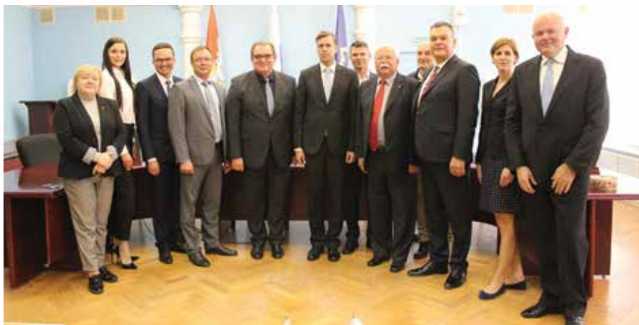
Подписание Соглашения о дружбе и сотрудничестве между г. Тольятти и г. Ново-Место

экономического потенциала города и области для Словенских компаний.