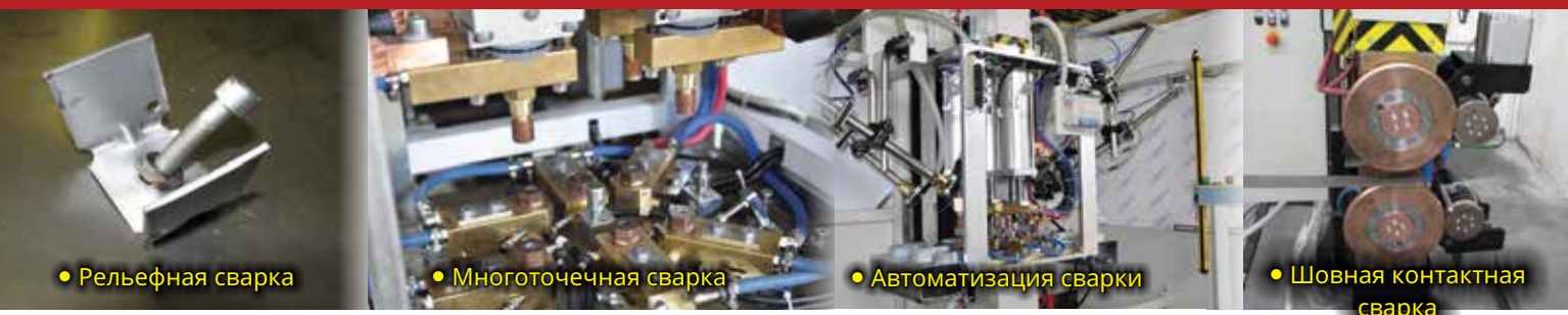
• Рельефная сварка